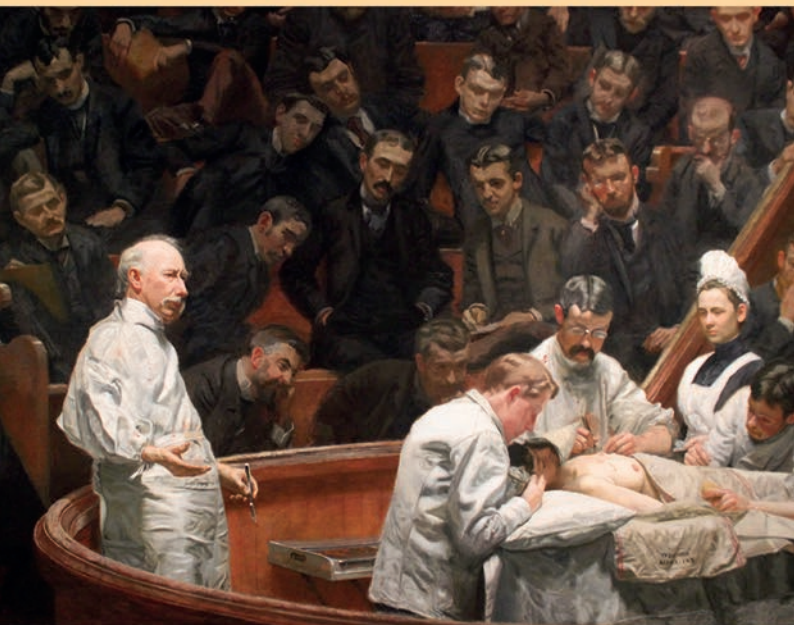
Thomas Eakins (1844-1916), La clinica Agnew , Dipinto ad olio del 1889 (Philadelphia Museum of Art)